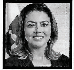
Sen. Leila Barros (PDT/DF)